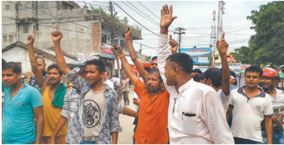
सप्तरीको राजविराजमा विहीवार प्रदर्शन गर्दै चालक। उनीहरू मुक्तौ संहिताका प्रावधान सच्याउन माग गर्दै आन्दोलनमा छन्।