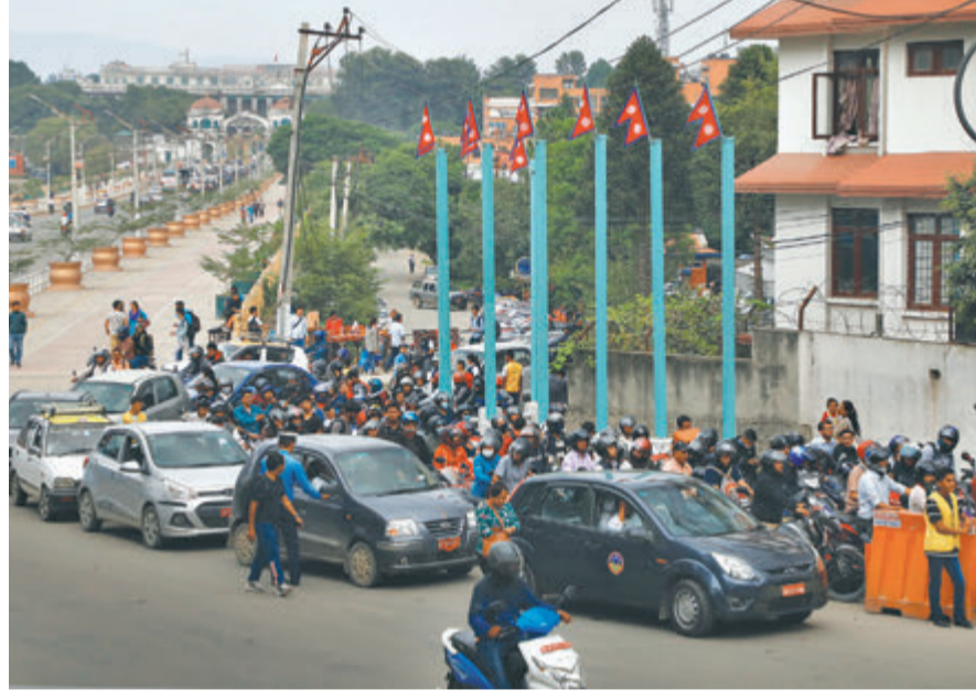
इन्धन दुबानी चालकको हडतालका कारण राजधानीमा पेट्रोलियम पदार्थ सुलभ नहुँदा विहीवार भद्रकालीस्थित नेपाली सेनाको पेट्रोल पम्पमा इन्धन भर्न लाइन लगेका सवारी साधन ।