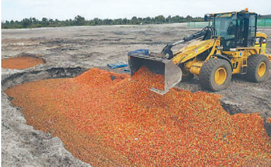
अस्ट्रेलियामा उत्पादित स्ट्रबेरीमा सियो भेटिएपछि नष्ट गरिँदै ।