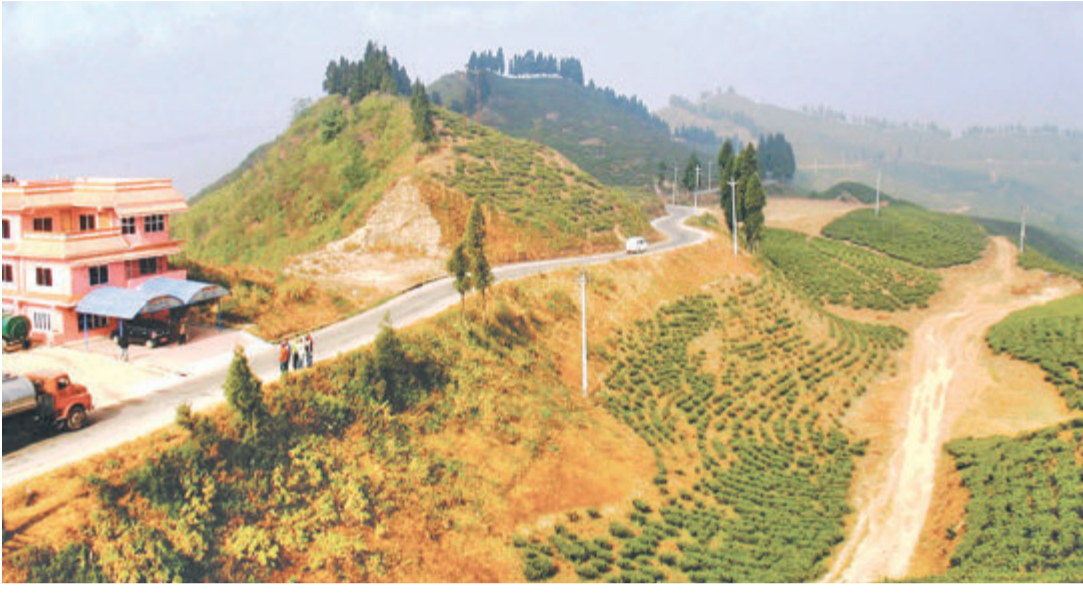
इलामको कन्यामस्थित होटल । सदरमुकाम र जिल्लाका ग्रामीण क्षेत्रमा पनि पर्यटक लक्षित सुविधासम्पन्न होटल खुल्ने क्रम बढेको छ ।