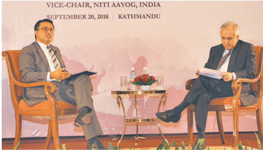
राजधानीमा बिहीबार काठमाडौं विश्वविद्यालय र बारवरा फाउन्डेसनले संयुक्त आयोजना गरेको नेपाल, भारत र छिमेकी सम्बन्ध तथा अर्थिक सुधारबारे भएको सांभजिक छलफलमा भारतीय नीति आयोगका उपाध्यक्ष राजीव कुमार (दायाँ) र राष्ट्रिय योजना आयोगका पूर्वउपाध्यक्ष स्वर्णिम वाग्ले।

रक्सौल-काठमाडौं विद्युतीय रेलमार्ग निर्माणको काम निर्धारित समयमै पूरा हुने भारतीय नीति आयोगका उपाध्यक्ष राजीव कुमारले बताएका छन्। भारतको नीति तथा योजना निर्माण गर्ने उच्च संस्थाका उपाध्यक्ष कुमारले रेलमार्गका लागि उल्लेखनीय रूपमा काम भइसकेकाले तोकिएको समयमै पूरा हुने बताए।