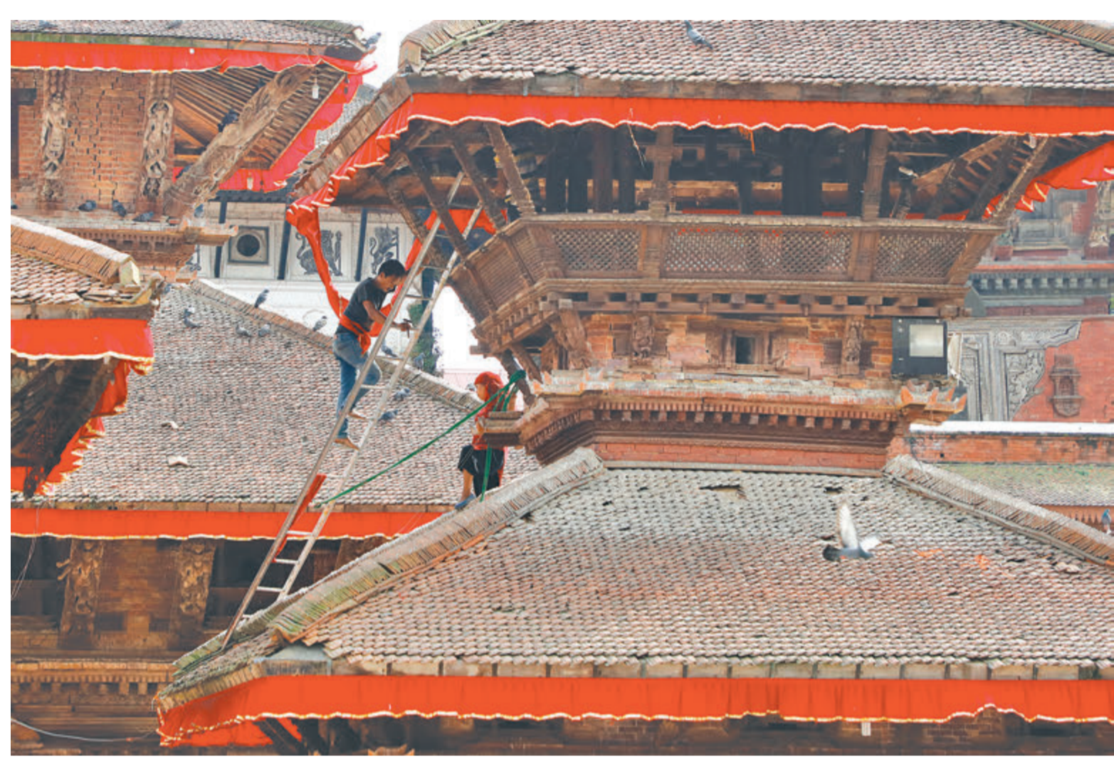
सम्पदाको रंगार | इन्द्रजावाको तथारीका क्रममा वसन्तपुर दरबार क्षेत्रका मन्दिरहरूलाई तोरणले सिँगारिँदै । काठमाडौंको ठूलामध्येको चाड इन्द्रजावा शुक्रबार सुरु भएर आठ दिनसम्म चल्नेछ ।