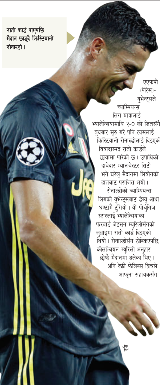
रातो कार्ड पाएपछि मैदान छाड्दै क्रिस्टियानो रोनाल्डो।