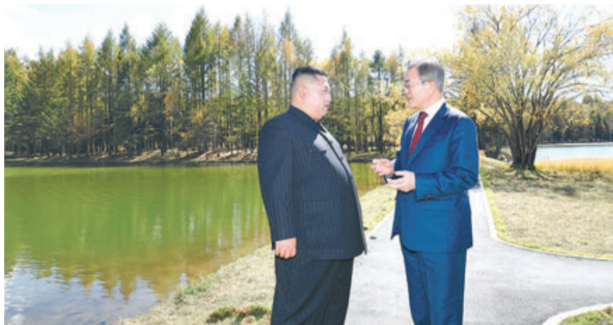
दक्षिण कोरियाली राष्ट्रपति मून जाय-इन (दायाँ) उत्तर कोरियाली नेता किम जोङ-उनसँग कुराकानी गर्दै । मून तीन दिन भ्रमण सकेर विहीबार सोल फर्केका छन् ।

अमेरिकी विदेशमन्त्री पोम्पियोले किमको महत्त्वपूर्ण प्रतिबद्धताका