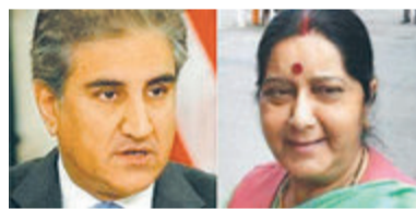
साह मोहम्मद कुरेसी र सुषमा स्वराज

अमेरिकाको न्युयोर्कमा आगामी साता हुने राष्ट्रसंघको ७३ औं महासभा बैठकका अवसरमा भारत र पाकिस्तानबीच वार्ता हुने भएको छ ।