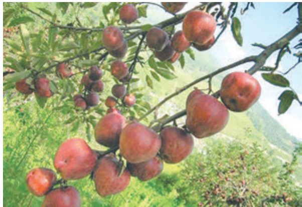
मुगुको राराताल नजिकैको गाउँमा गरिएको स्याउ खेती।

रुचाएका छन्। उनले भने, ‘पर्यटकले लैजान थालेपछि स्थानीयको आयआर्जन पनि बढेको छ।’ स्याउ किन्न पर्यटक गाउँमै पुग्ने गरेको उनले बताए। मुर्माका विखेवहादुर रोकायाले पर्यटकले कोसेलीका रूपमा लैजान थालेपछि स्याउ र सिमीले भाउ पाएको बताए। उनले सिमी बेचेर सिजनमा ४० हजार रुपैयाँ कमाउने गरेको बताए। उनका अनुसार माघ बढेपछि मुर्मागाउँका ६५ घरवुरीले व्यावसायिक रूपमा सिमी र स्याउ उत्पादन थालेका छन्। मौसम सफा भएपछि असोजबाट रारा घुम्ने आन्तरिक पर्यटकको संख्या बढ्ने उनको भनाइ छ। सिमी खाँदो र पोसिलो हुने भएकाले माघ बढेको हो। असोजमा रारा पुगेका पर्यटकले