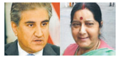
साह मोहम्मद कुरेसी र सुषमा स्वराज