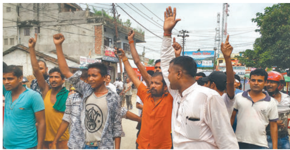
सप्तरीको राजविराजमा विहीवार प्रदर्शन गर्दै चालक। उनीहरू मुक्त संहिताका प्रावधान सच्याउन माग गर्दै आन्दोलनमा छन्।