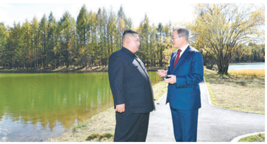
दक्षिण कोरियाली राष्ट्रपति मून जाय-इन (दायाँ) उत्तर कोरियाली नेता किम जोङ-उनसँग कुराकानी गर्दै । मून तीन दिन भ्रमण सकेर विहीबार सोल फर्केका छन् ।

वासिङ्टन (रोयटर्स/एएफपी)- अमेरिकाले कोरियाली द्वीपमा परमाणु निःशस्त्रीकरणका लागि पुनः उत्तर कोरियासँग वार्ता गर्न तयार रहेको जनाएको छ । विदेशमन्त्री माइक पोम्पियोले 'उत्तर कोरियालाई सन् २०२१ भित्र पूर्णरूपमा परमाणु अस्त्रविहीन बनाउन पुनः वार्ता गर्न तयार रहेको' विहीबार बताएका हुन् । अमेरिका र उत्तर कोरियाबीचगत जुन १२ मा सिंगापुरमा शिखर बैठक भएको थियो । उक्त वार्ताका क्रममा दुई पक्षबीच परमाणु निःशस्त्रीकरण लगायत विषयमा सहमति भएको थियो । यद्यपि, उक्त कार्यका लागि ठोस कदम भने चालिएको छैन । तर यसै साता भएको दुई कोरियाली शिखर बैठकपछि परमाणु निःशस्त्रीकरणको मुद्दामा थप कदम चालिने संकेत देखिएको छ । दक्षिण कोरियाली राष्ट्रपति मून जाय-इनसँग उत्तर कोरियाली नेता किम जोङ-उनले आफ्नो मुख्य क्षेत्राध्यक्ष प्रक्षेपण केन्द्र बन्द गर्न सहमत भएका थिए । शिखर बैठकका पहिलो पटक प्योङयाङ पुगेका मूनले दसौं हजार उत्तर कोरियालीको माफमा अभूतपूर्व भाषण गरेका थिए । उक्त अवसरमा मूनले भनेका थिए, 'परमाणु निःशस्त्रीकरणका लागि नेता किम सहमत छन् ।' अमेरिकी विदेशमन्त्री पोम्पियोले किमको महत्त्वपूर्ण प्रतिवद्धताका