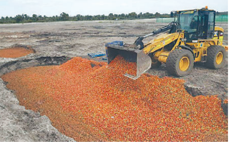
अस्ट्रेलियामा उत्पादित स्ट्रबेरीमा सियो भेटिएपछि नष्ट गरिँदै ।