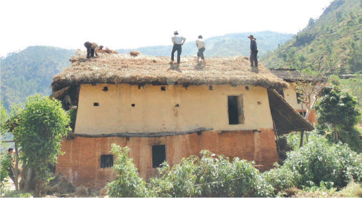
रुकुम पूर्व सिस्ते गाउँपालिका ५, दुधिनौरा गाउँको खरको छाएको पुरानो घर ।