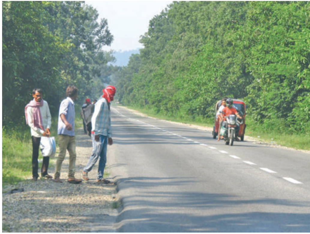
नेपाल स्वतन्त्र सवारी चालक संघर्ष समितिले आह्वान गरेको अनिश्चितकालीन आन्दोलनका कारण सवारी साधन ठप्प भएपछि पूर्वपश्चिम राजमार्गमा बिहीबार गुडेका साना सवारी ।