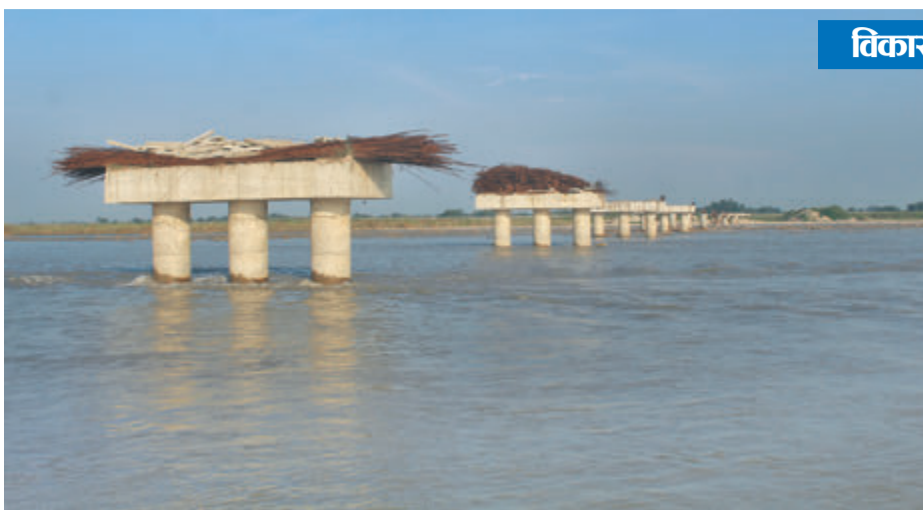
भ्रामाको हुलाकी राजमार्गअन्तर्गत कन्काई नदीमा निर्माणाधीन पुल । पप्पु कन्स्ट्रक्सनले ४ वर्षमा पूरा गर्नुपर्नेमा ७ वर्ष पुग्दा पनि आधा काम भएको छैन । निर्धारित समयमा पुल नबन्दा सबैसाधारण जोखिम मोलेरै काठको डुंगामा नदी वारपार गर्न बाध्य छन् ।