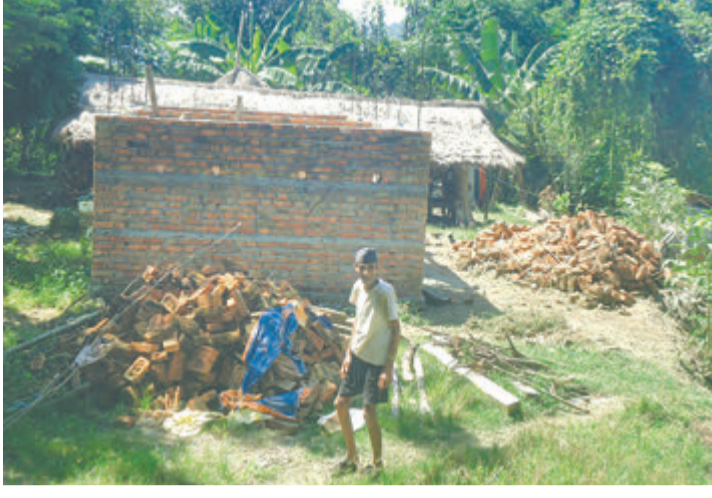
गोरखाको सिरानचोक गाउँपालिका ४ छोप्राकस्थित माफगामवेसीमा निर्माण सामग्री ढुवानी हुन नसक्दा अलपत्र भूकम्प प्रतिरोधी घर।

उक्त गाउँका निर्माणशील अधिकश घर गारो लगाएर छाप्ने तयारीमा छन्।