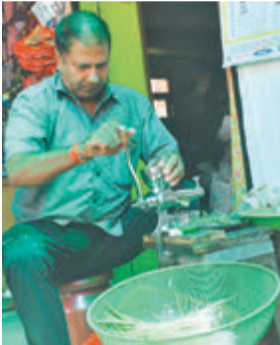
मेसिनमा जमराको जुस पेल्लै व्यापारी।