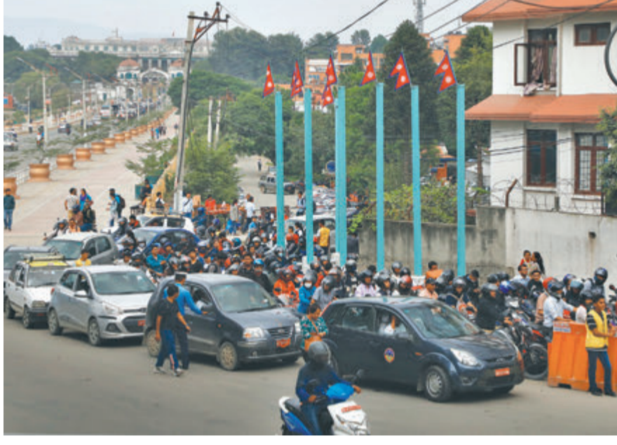
इन्धन दुबानी चालकको हडतालका कारण राजधानीमा पेट्रोलियम पदार्थ सुलभ नहुँदा विहीबार भद्रकालीस्थित नेपाली सेनाको पेट्रोल पम्पमा इन्धन भर्न लाइन लगेका सवारी साधन ।