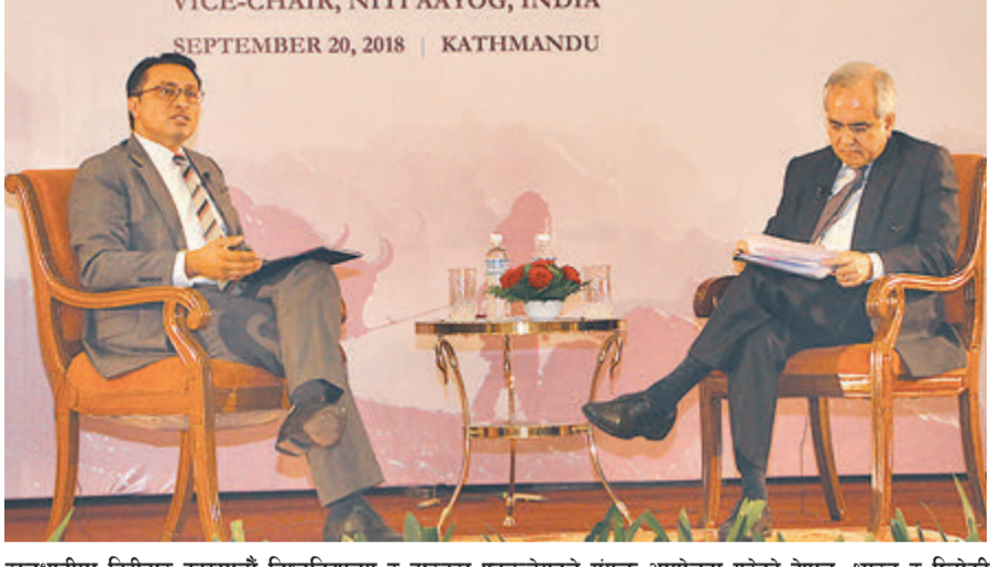
राजधानीमा बिहीबार काठमाडौं विश्वविद्यालय र बारबार फाउण्डेसनले संयुक्त आयोजना गरेको नेपाल, भारत र छिमेकी सम्बन्ध तथा आर्थिक सुधारबारे भएको सांविधिक छलफलमा भारतीय नैतिक आयोगका उपाध्यक्ष राजीव कुमार (दायाँ) र राष्ट्रिय योजना आयोगका पूर्वउपाध्यक्ष स्वर्णम वाग्ले।

रक्सौल-काठमाडौं विद्युतीय रेलमार्ग निर्माणको काम निर्धारित समयमै पूरा हुने भारतीय नीति आयोगका उपाध्यक्ष राजीव कुमारले बताएका छन्। भारतको नीति तथा योजना निर्माण गर्ने उच्च संस्थाका उपाध्यक्ष कुमारले रेलमार्गका लागि उल्लेखनीय रूपमा काम भइसकेकाले तोकिएको समयमै पूरा हुने बताए।