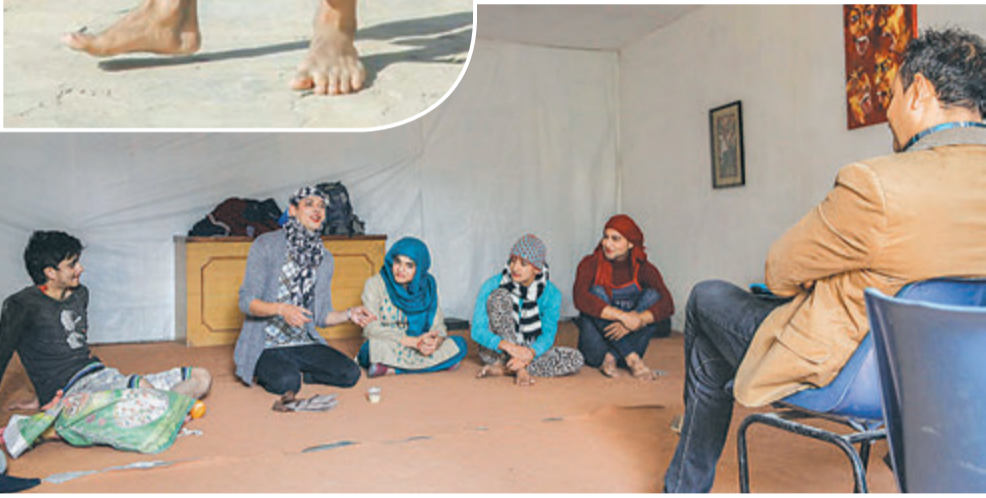
राजधानीको ओस्कार इन्टरनेसनल कलेज अफ फिल्म स्टडिजमा कौशल सिब्दे विद्यार्थीहरू।

'स्क्रिनमा आउनु, सेलेब्रिटी बन्न भन्ने कुरा आफैँमा आकर्षक छ। आर्थिक पक्ष पनि राम्रो भएपछि यसतर्फ आकर्षण बढेको हो।'