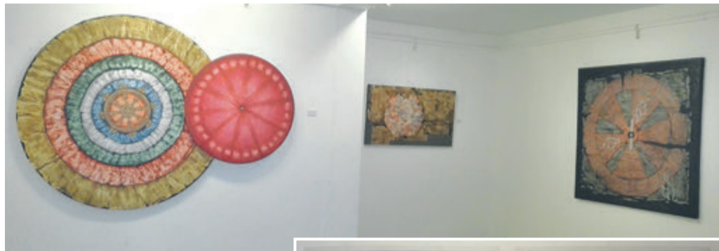
राजधानीको वबरमहलस्थित सिद्धार्थ आर्ट ग्यालरीमा प्रदर्शनमा राखिएका चित्रकृति।

'समयले संस्कृतिमा पनि परिवर्तन ल्याउँदै छ,' वबरमहलस्थित सिद्धार्थ आर्ट ग्यालरीमा उनले भनिन्, 'मुस्ताङ पुगेपछि भन्न राम्रोसँग बोध भयो।' ग्यालरीमा