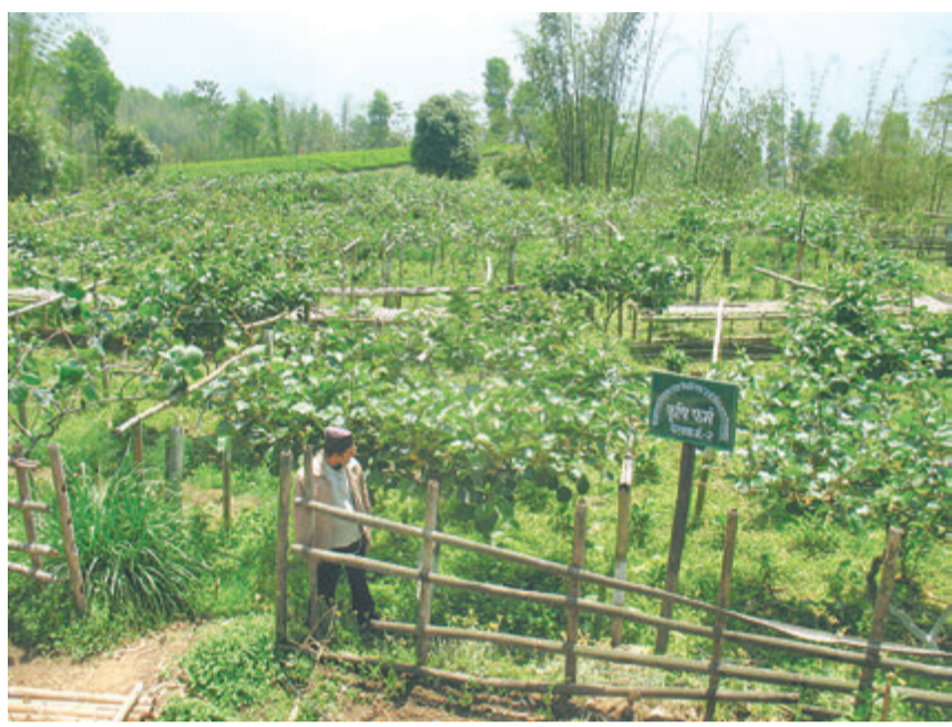
साँखेजुडमा रहेको किबी बगान। किबी उत्पादन हुने सन्दकपुर गाउँपालिका र इलाम नगरपालिकाका केही वडालाई किबी जोन घोषणा गरिएको छ।

किबी खेतीलाई प्रवर्द्धन गर्ने उद्देश्यले कार्यान्वयनमा आउन लागेको किबी जोनका लागि इलाममा क्षेत्र छनोट गरिएको छ। जोनका लागि सन्दकपुर गाउँपालिका र इलाम नगरपालिकाका ४ वटा वडा छनोटमा परेका छन्। सन्दकपुर गाउँपालिकाका ५ वटै वडा र इलाम नगरपालिकाका १, २, ३ र ४ नम्बर वडामा जोन कार्यक्रम हुनेछ। प्रधानमन्त्री कृषि आधुनिकीकरण प्रयोजनान्तर्गत जिल्लामा किबी जोन कार्यक्रम सञ्चालन हुने निश्चित भएको हो। पाँच सय हेक्टरभन्दा धेरै जमिनमा किबी खेती भएको र यो क्षेत्र जोन सञ्चालनका लागि उपयुक्त देखिएको छ। यी बाहेक कृषकको मागअनुसार उपयुक्त मापदण्ड पुगेका स्थानलाई पकेट कार्यक्रम सञ्चालन गरिने भएको छ। जोन सञ्चालनपछि कृषि व्यवसाय प्रवर्द्धन, स्रोत केन्द्रको विकास, पोस्ट हार्भेस्ट सेक्टर स्थापना, प्रविधि तथा प्राविधिक सहयोग, कृषि यान्त्रीकरण र साना सिंचाइमा सहयोग पुग्नेछ। किबी जोन अन्तर्गत किबीका विस्तारमा ५० प्रतिशत, प्रयोगशाला सेवामा ८५ प्रतिशत, कृषि औजार तथा उपकरणमा ५० प्रतिशत, साना