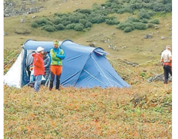
अपी हिमाल आरोहणका लागि बेस क्याम्प पुगेका पर्यटक ।