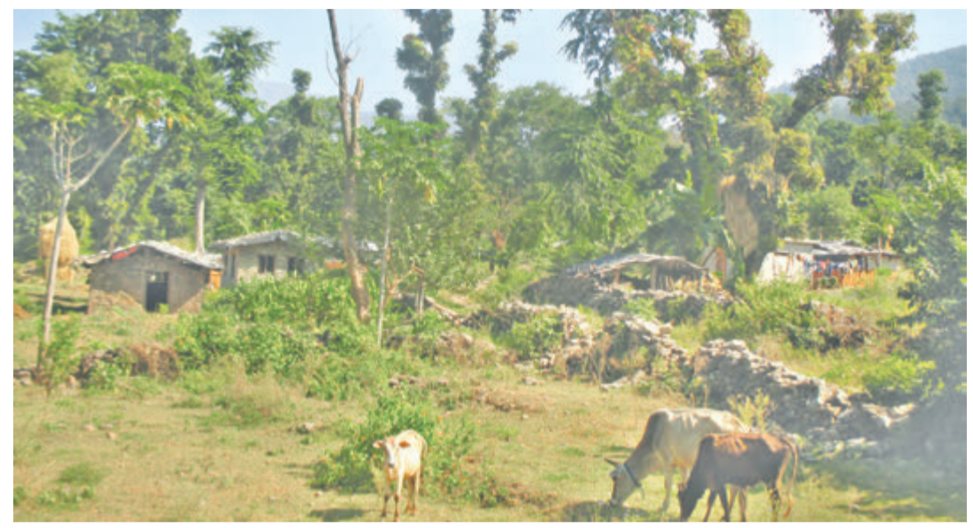
ब्रह्मदेव करिडोरअन्तर्गत पर्ने भीमदत्त नगरपालिका-९, खल्लामा वन अतिक्रमण गरेर बसेको बस्ती।