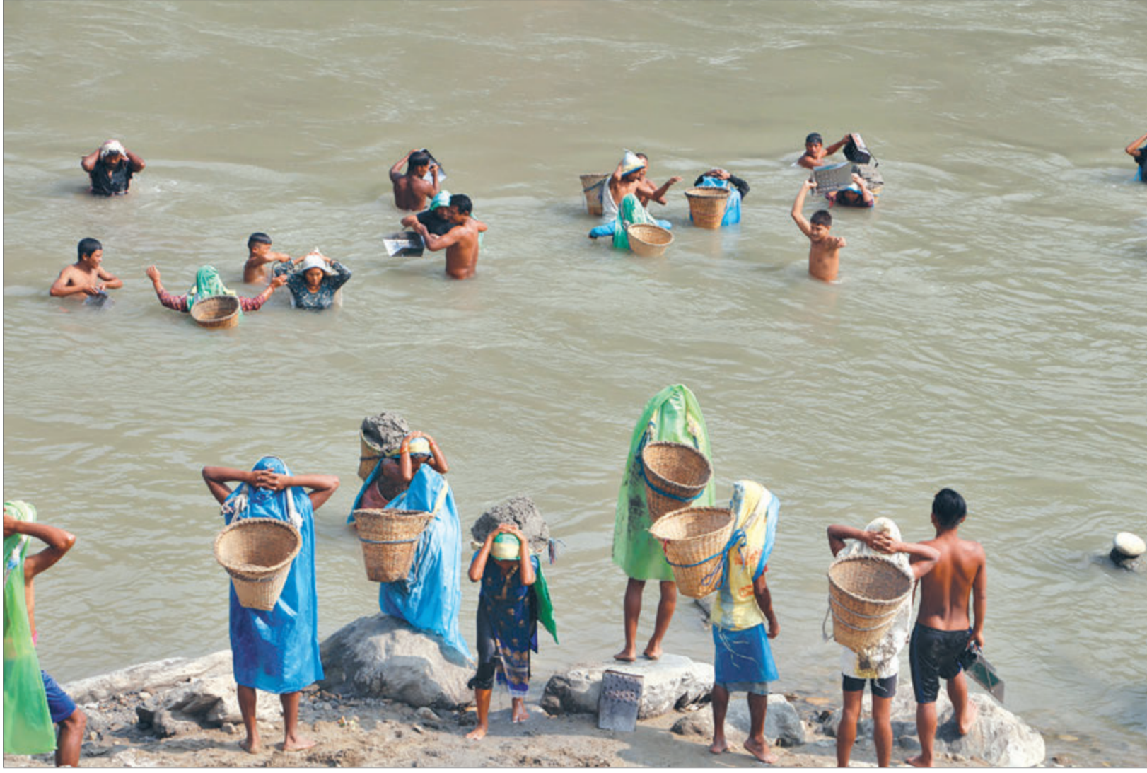
विशाली नदीको बीचसम्मै पुगेर बालुवा फिक्ने मजदुर। नदीको बढ्दो दोहन रोकन मसिनरी प्रयोग बन्द गरिए पनि व्यक्तिगत रूपमा बालुवा फिक्ने क्रम जारी छ। मजदुरले बालुवा बेचेर हरेक दिन प्रतिव्यक्ति ३ देखि ५ हजार रुपैयाँसम्म कमाइ गर्दै आएका छन्।

काठमाडौं (कास)- संघीय मामिला तथा सामान्य प्रशासन मन्त्रालयले सबै स्थानीय तहलाई खसी, बोकामा र च्याप्रा व्यवसायीसँग कर नउठाउन निर्देशन दिएको छ। दसैँको मुखमा राजधानी र अन्य मुख्य सहरमा खसी, बोका, च्याप्रा, कुखुरा लैजाने क्रममा स्थानीय तहहरूले कर उठाउन थालेपछि मन्त्रालयले बिहीबार निर्देशन दिएको हो। संघीय मामिला मन्त्रालयको साँचवस्त्रको निर्णयबाट सबै स्थानीय तहलाई कर संकलन नगर्न परिपत्र गरिएको हो। स्थानीय सरकार सञ्चालन ऐन २०७४ को दफा ६१ मा 'जीवजन्तु र चौपायाको व्यापार-व्यवसाय गर्नेबाट व्यवसाय कर वा हाटवजारमा खरिद-बिक्री भएको अवस्थामा बाहेक अन्य कुनै किसिमको कर, शुल्क आदि उठाउन नमिल्ने' व्यवस्था छ।