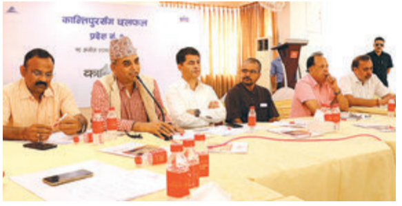
विराटनगरमा बिहीबार कान्तिपुर मिडिया ग्रुपले आयोजना गरेको कार्यक्रममा सहभागीहरू।