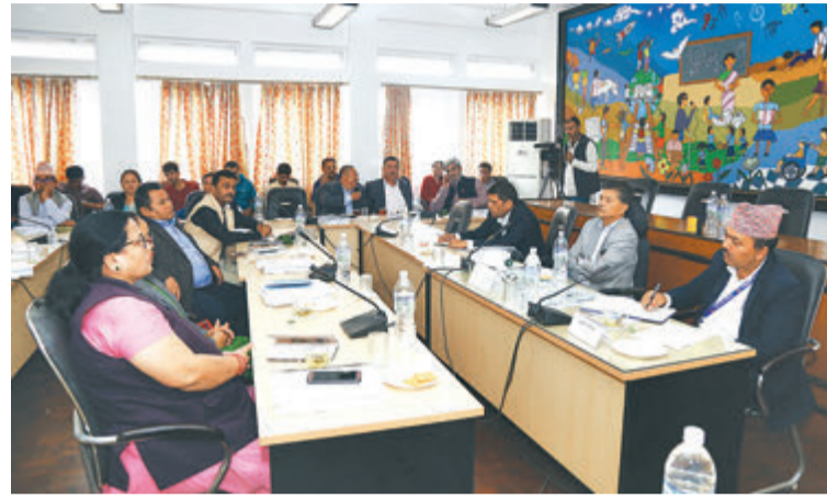
व्यवस्थापिका संसद्को सार्वजनिक लेखा समितिको विहीवार बसेको बैठकका सहभागी।

बजारमा अस्वाभाविक मूल्यवृद्धि भएपछि बुधवार उद्योग वाणिज्य तथा आपूर्ति मन्त्रालयले पनि चिनीको अधिकतम खुद्रा विक्री मूल्य ७० रुपैयाँ तोक्ने निर्णय गरेको छ। चिनीमा मनलादी बढीमा विक्री गर्नेलाई कारवाही गर्ने निर्णय गरेको