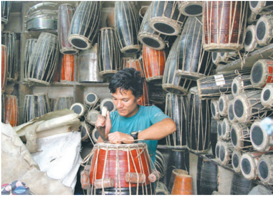
काठमाडौंको प्याफलमा मादल बनाउँदै कामदार।