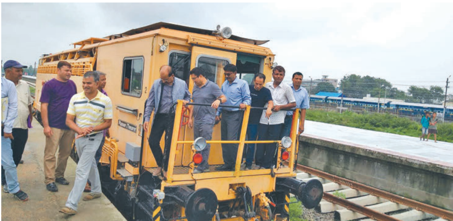
जनकपुर-जयनगर रेलवेको बिहीबार सफल परीक्षण र निरीक्षणपछि रेलबाट ओल्टै नेपाल र भारतको संयुक्त टोली।

जयनगरबाट जनकपुर हुँदै कुर्थासम्म (३५ किमि) को काम आगामी मंसिरभित्रै सकने तयारी छ। बाँकी दुई चरणमा महोत्तरीको बर्दवाससम्म जोड्ने गरी ६९ किमि रेलवे बनाइँदै छ। तीन वर्षभित्र यो पूरै रूटमा रेल गुड्ने प्राविधिकले दाबी गरेका छन्।