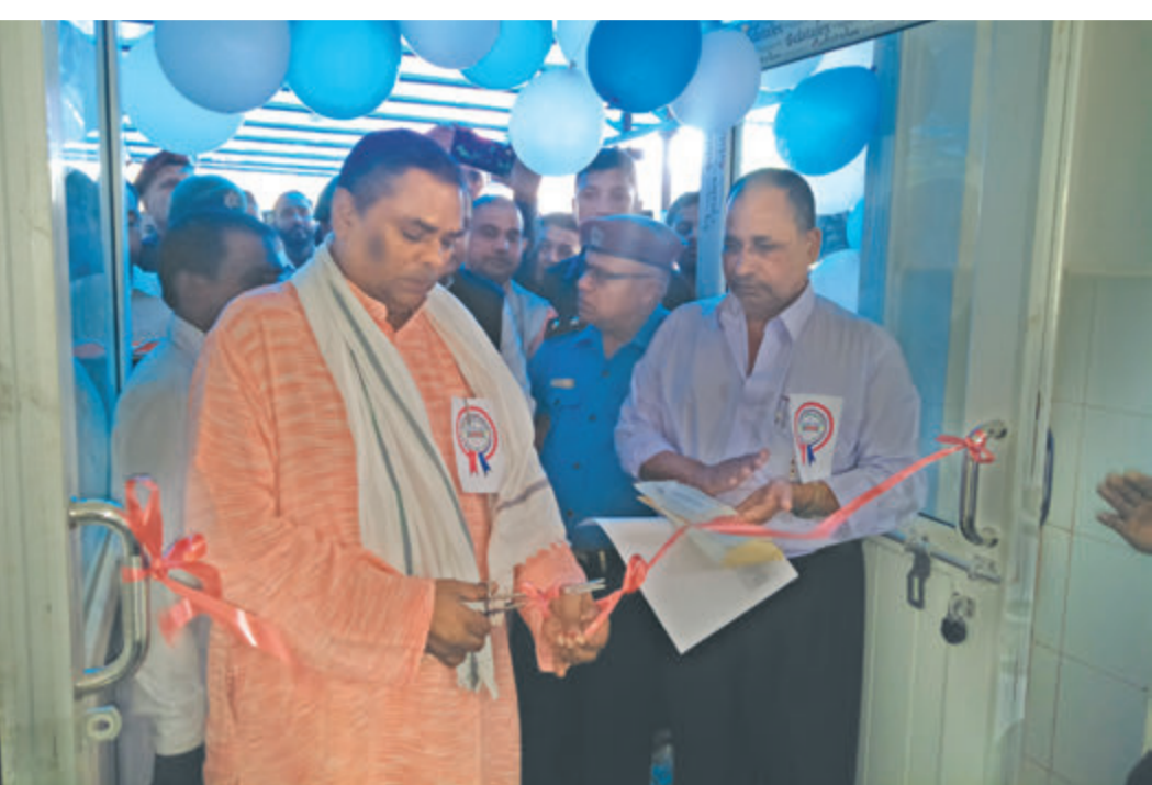
निर्माण अपुरै रहेको जनकपुर अञ्चल अस्पतालको बहिरंग भवनको उद्घाटन गर्दै उपप्रधान तथा स्वास्थ्यमन्त्री यादव ।

अस्पतालको फ्याल लगाउने बाँकी छ, खानेपानीको नलमा पानी जोडिएको छैन, विद्युतको काम सकिएकै छैन, अन्तिम फिनिशिंग भएकै छैन, एक कर्मचारीले भने, 'अचानक मेसुले उद्घाटन कार्यक्रम राखेको हो ।' काम सम्पन्न नभएकाले ठेकेदारले अस्पताल भवन हस्तान्तरण गरेको छैन ।