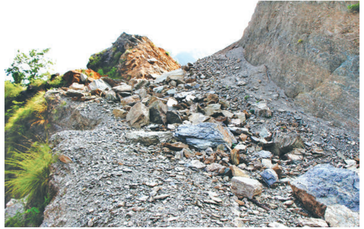
उत्तर-दक्षिण कालीगण्डकी करिडोरअन्तर्गत पाल्पाको रानीमहल क्षेत्रमा हिमदुङ एन्ड ठोकर कन्स्ट्रक्सन प्रा. लि.ले ६ वर्षअघि ठेक्का लिएर अलपत्र सडक ट्याक।

आयोजनाले पनि निर्माण व्यवसायीलाई काम लगाउन सकेको छैन। दबाव दिन र कालोसूचीमा राख्ने प्रक्रिया थालेको छैन। 'सांसदको कम्पनीलाई कालोसूचीमा राख्न नसकिएको हो,' निमित्त आयोजना प्रमुख कृष्ण खड्काले भने, 'सुकै ठेक्का भएको र विभिन्न कारणले गर्दा काम गराउन सकिएन।' खनिको ट्याकमा समेत पहिरोले गाडी चल्न सकेको छैन। त्यस क्षेत्रमा भीर, चट्टाने भूभाग छ। आयोजनाका अनुसार ट्याक खुलेको छैन, १० मिटर चौडालगायत स्टरोन्तित काम गर्नुपर्ने ठेक्का सम्झौतामा उल्लेख छ। 'सम्झौताअनुसार अर्को ट्याक खुलेको छैन,' खड्काले भने, 'पुरानो ठेक्का हो तर काम