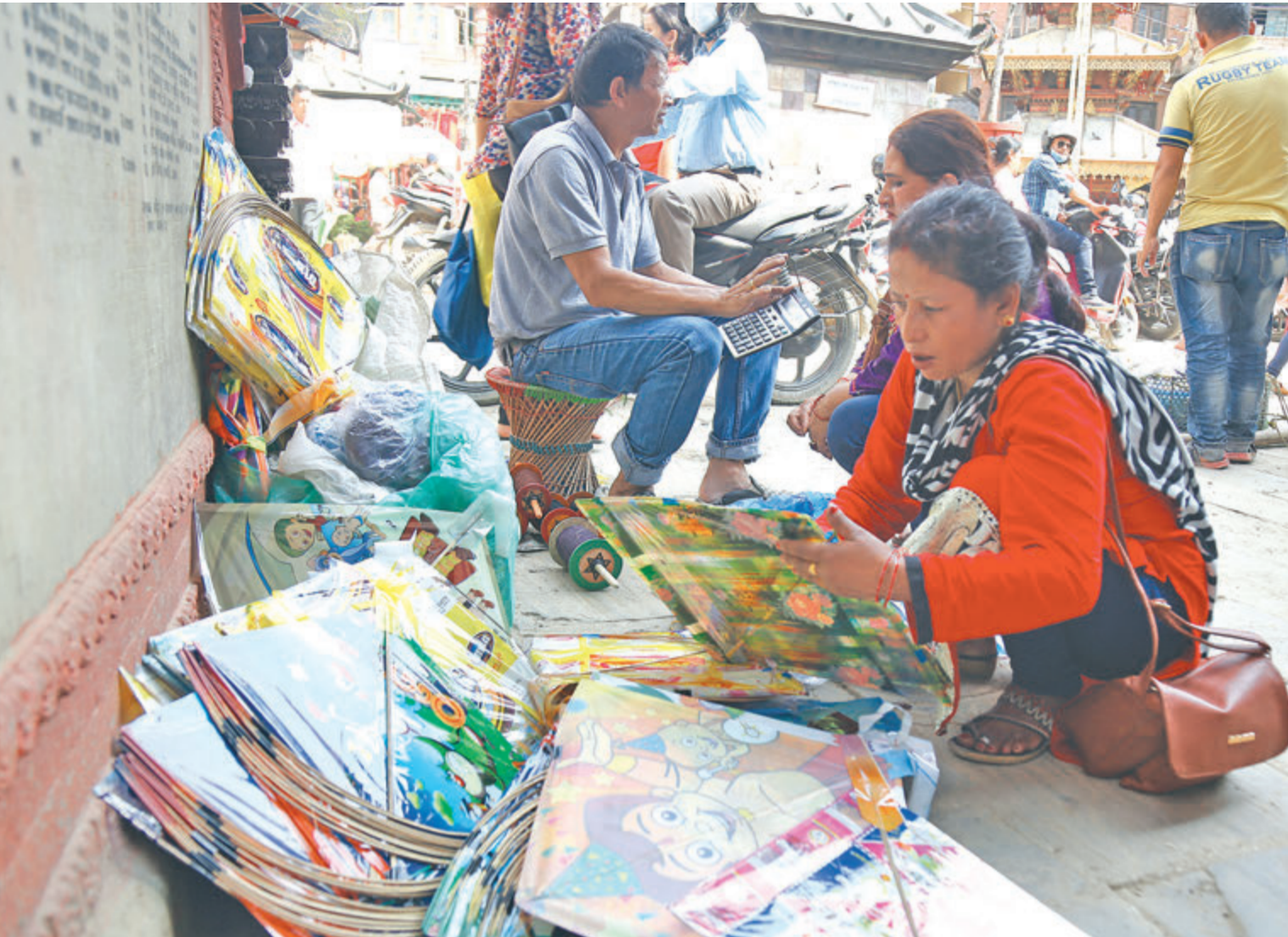
काठमाडौंको असनमा चंगा छान्दै ग्राहक । र्दसै नजिकिदै गर्दा राजधानीमा चंगाको व्यापार बढेको छ । र्दसैमा चंगा उडाएर रमाइलो गर्ने चलन छ ।