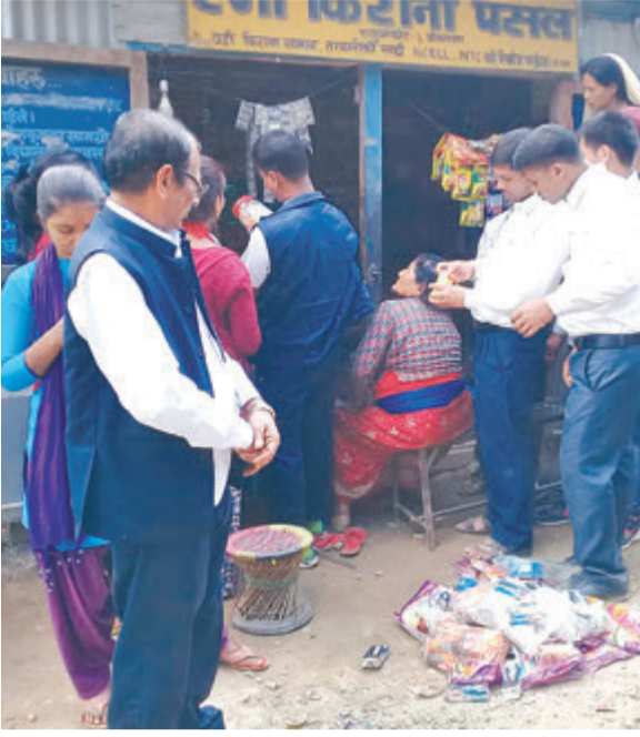
रूकुमपूर्व सिस्ने गाउँपालिकाको एउटा पसलमा अनुगमन गर्दै टोली।

पूर्वी रूकुमको सिस्ने गाउँपालिकाका २ वडाका १ य १० पसलमा गरिएको अनुगमनमा विभिन्न कैफियत फेला परेको छ। ५ र ६ नम्बर वडास्थित बजार अनुगमनमा अधिकांश पसलमा कुनै न कुनै कैफियत भेटिएको अनुगमन समितिले जनायो। साविक रूकुमबाट अलगिएर बनेको कान्छे जिल्लामा पहिलोपटक सोमवार र मंगलवार अनुगमन गरिएको थियो। टोलीले पसललाई लिखित सुभाब दिएका छ।