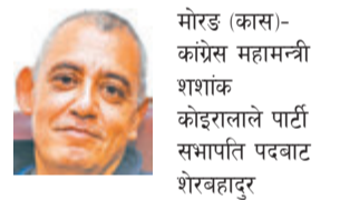
देउवालाई आउँदो महाधिवेशनमा हटाउने बताएका छन्।

मोरङ (कास)- शशांक महामन्त्री घोषालको कोइरालाले पार्टी सभापति पदबाट शेरबहादुर देउवालाई आउँदो महाधिवेशनमा हटाउने बताएका छन्। विराटनगरमा बिहीबार पत्रकारसँग कुरा गर्दै उनले सभापति देउवाको कार्यशैली प्रभावकारी नभएकाले पार्टी जोगाउन सशक्त नेतृत्वको आवश्यकता भएको बताए। 'पार्टीले निर्वाचनमा हार बेहोर्नु र अहिलेको स्थितिमा आउनुको सम्पूर्ण दोष सभापतिलाई नै दिन चाहन्छु,' उनले भने, 'उहाँको नेतृत्वमा म पनि महामन्त्री भएकाले त्यसको नैतिक जिम्मेवारी मतलगायत पार्टीका अन्य सदस्यले पनि लिनुपर्छ।' कोइरालाले पार्टीको आगामी नेतृत्वबारे देशभरको भावना बुझेर निर्णय लिने बताए। 'सभापतिको दावेदार मसहित